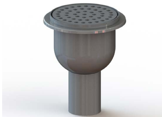
Kuvassa pystykaivo 9090/1

Kaivo voidaan tehtaalla liittää suoraan lattia-altaaseen, mikä tarjoaa joustavuutta eri asennusvaihtoehtoihin.