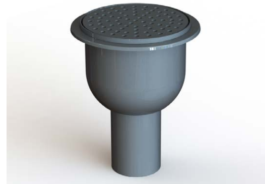
Kuvassa pystykaivo 9091/1

Kaivo voidaan tehtaalla liittää suoraan lattia-altaaseen, mikä tarjoaa joustavuutta eri asennusvaihtoehtoihin.